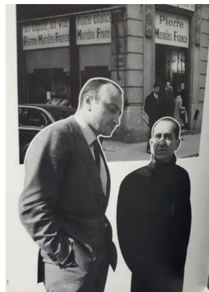
Grenoble 1967 - Plon, 1992