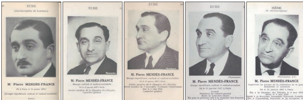
Illustrations pages 1 et 4

La vérité guidait leurs pas. Préface, page 24